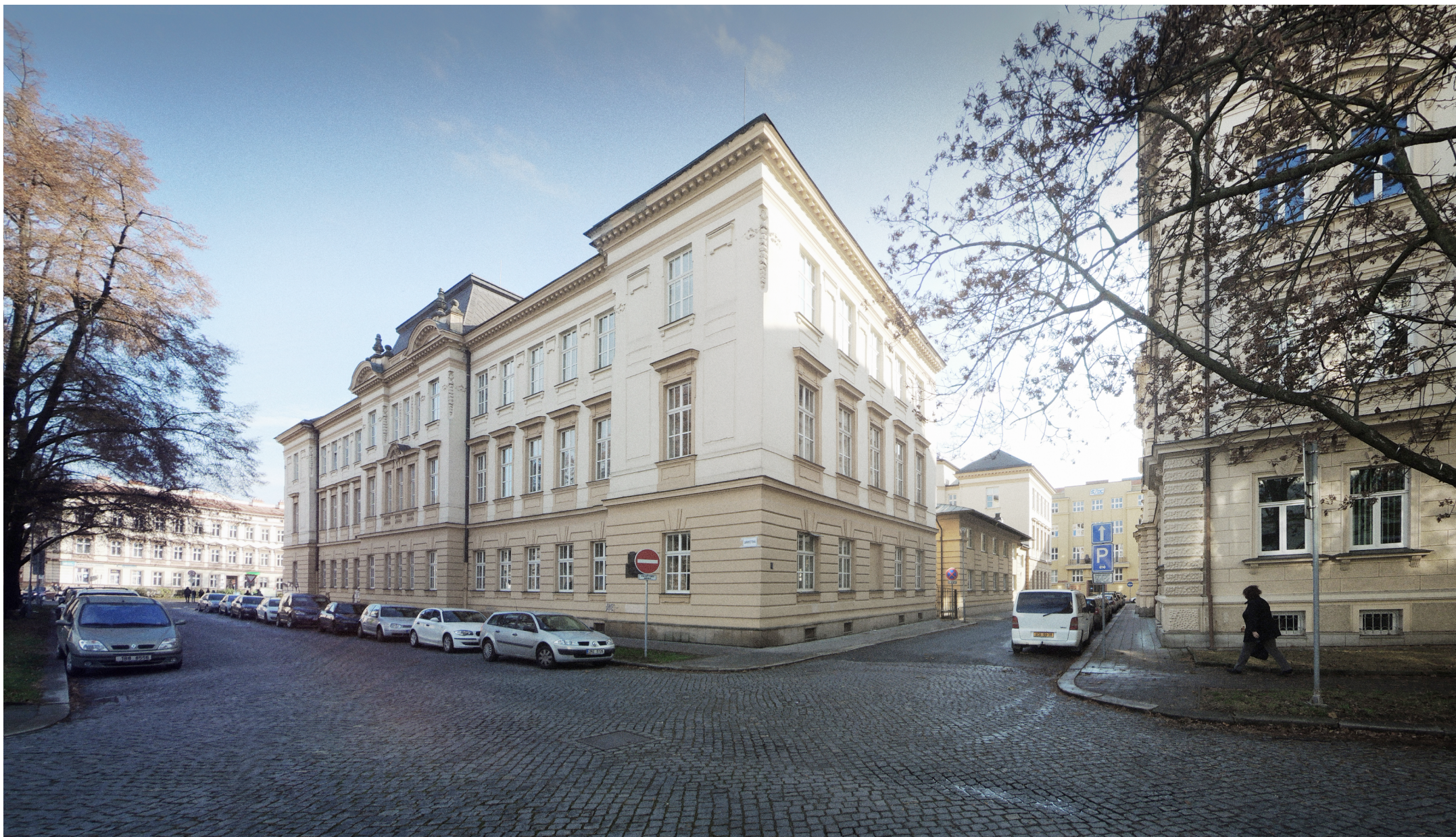
ZÁKRES DO FOTOGRAFIE - STÁVAJÍCÍ STAV (r. 2016)